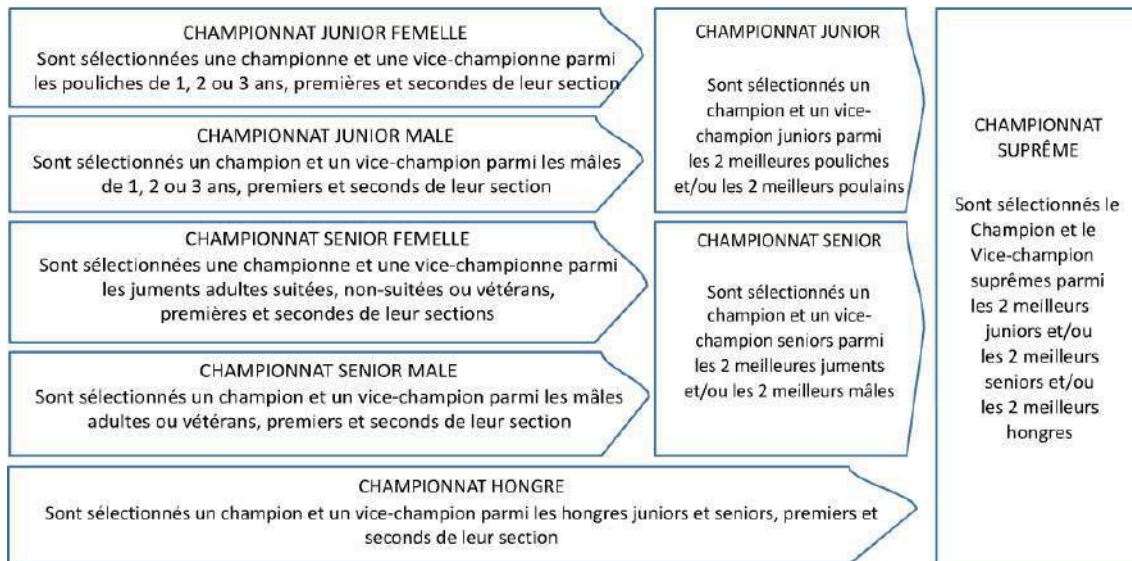
Schéma de l'organisation des championnats identique pour les 3 tailles (Mini, Intermédiaire et Standard) :

Tout poney obtenant le titre de Champion suprême avec la qualification « Très Excellent » ou « Très Prometteur » dans un concours régional ne pourra pas participer à un autre concours de même niveau durant l'année en cours. Par contre, il peut participer au Championnat de France.