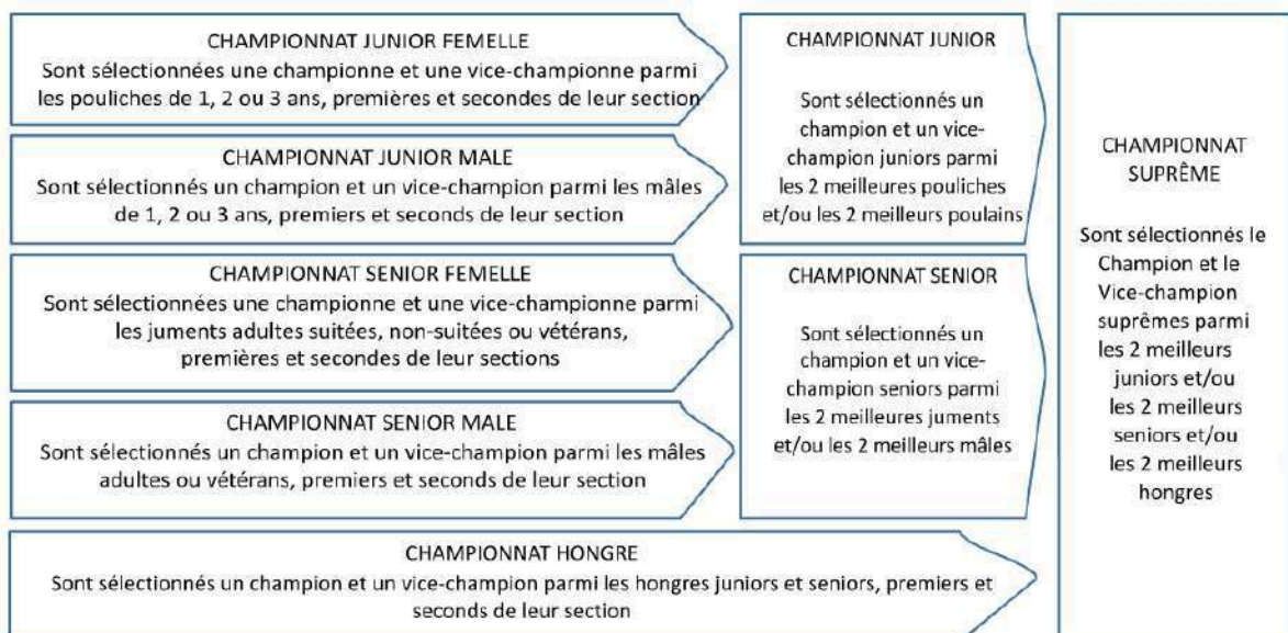
Schéma de l'organisation des championnats suprêmes, identique pour les 3 tailles (Mini, Intermédiaire et Standard) :

Les sections vétérans et hongres regroupant des poneys de taille et d'âge différents, ces derniers intègrent le championnat correspondant à leur catégorie de taille.